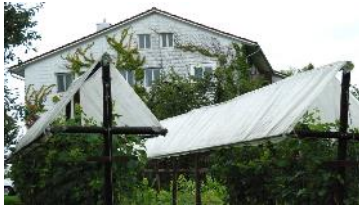
Site de Schlachters