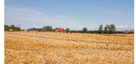
Agriculture durable & Systèmes énergétiques