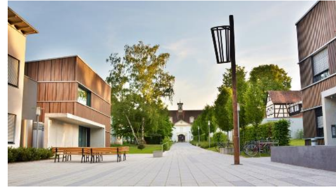
Campus de Triesdorf