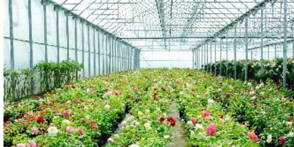
Horticulture et technologie alimentaire