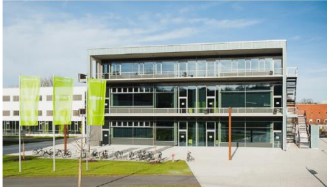
Campus de Weihenstephan