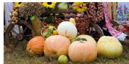
Agriculture, alimentation et nutrition