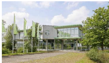
Campus de l'innovation