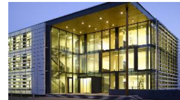
Site de Straubing