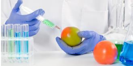
Sciences de la bio- ingénierie