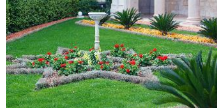
Architecture du paysage